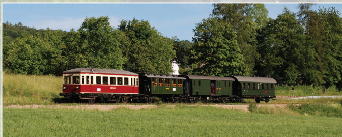
Dieseltriebwagen VT 3 am 08.06.2019 auf der Fahrt nach Kandern.

Hotel Restaurant Axion Freiburger Str. 46, Haltingen Tel. +49 (0) 7621 / 1 63 33 00